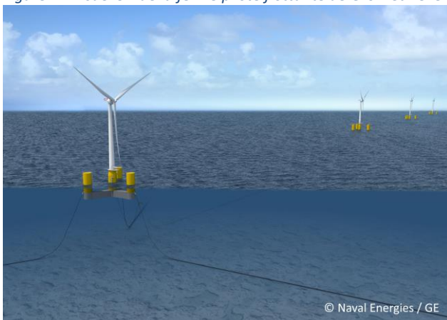
Figure 2 : Visuel 3D de la ferme pilote flottante de Groix et Belle-Ile